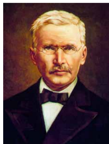
Ein Vater der Genossenschaftsidee: Friedrich-Wilhelm Raiffeisen